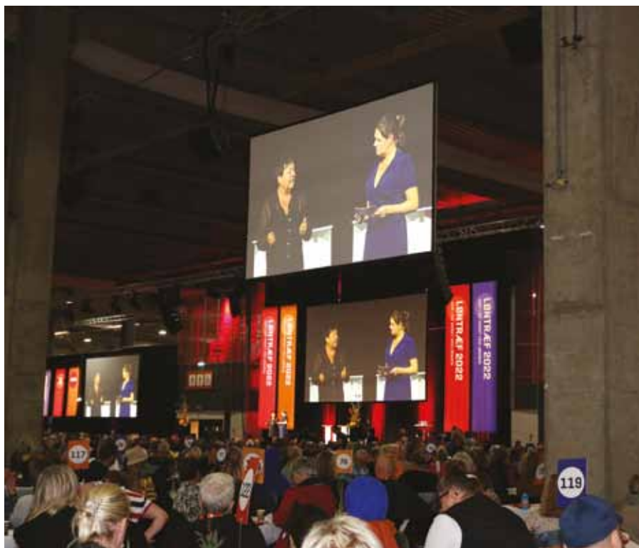
Messe C i Fredericia var rammen for det enorme træf, hvor 1200 ud af FOA's ca. 4200 tillidsrepræsentanter var samlet.