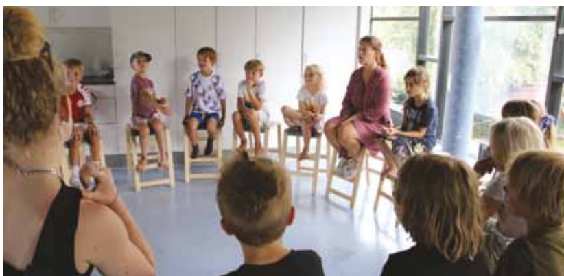
På Vestervang fritidshjem starter de hver eftermiddag med et børnemøde. På børnemødet taler de om, hvordan dagen har været indtil videre, og hvilke aktiviteter dagens fritidshjemsdag byder på.