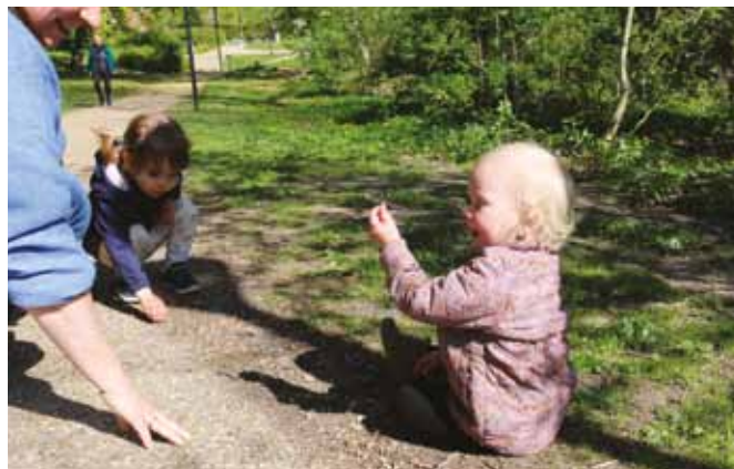
Når det lille barn undersøger de små sten, er det taktilsansen, der trænes. Sansereceptorerne er overalt i huden og i vores slimhinder og registrerer sanseindtryk som fx varme, kulde, overflader og teksturer, smerte og velbehag.

Labyrintsansen (eller den vestibulære sans) registrerer hovedets bevægelser i forhold til tyngdekraften, og hjælper os dermed med at orientere os i rum-retningsbegreber som op, ned, højre, venstre, over, under, dreje rundt. Den giver os information om, hvor vi befinder os i rummet og i forhold til omgivelserne. Den lader os også vide, om vi er