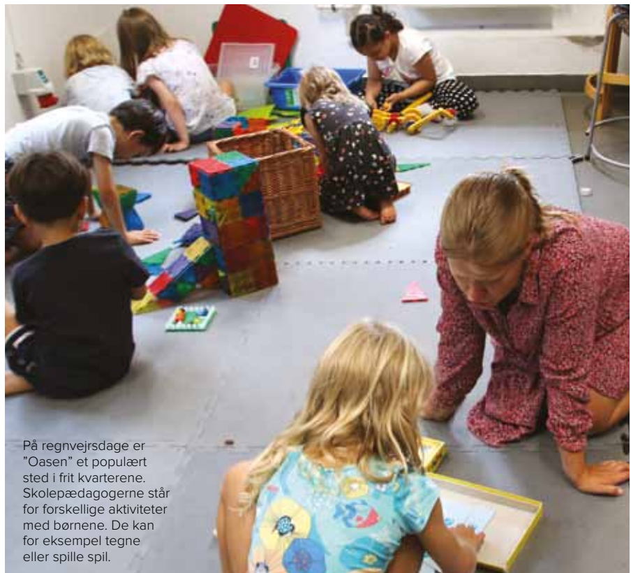
På regnvejrsdage er ”Oasen” et populært sted i frit kvarterene. Skolepædagogerne står for forskellige aktiviteter med børnene. De kan for eksempel tegne eller spille spil.