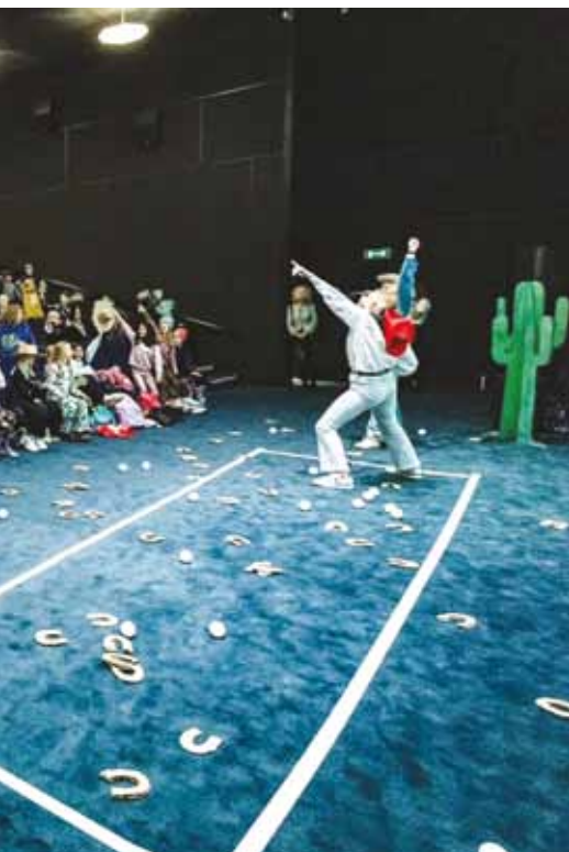
Foto: Historier fra fuglehuset, Pressebillede, Buster Filmfestival.

Historier fra fuglehuset er en samling smukke, korte animerede film for børnehavebørn fra det prisbelønnede franske filmselskab Dandelooo. Filmene er baseret på ni børnebøger af hæderkronede europæiske illustratører og er meget forskellige i streg og stemning.