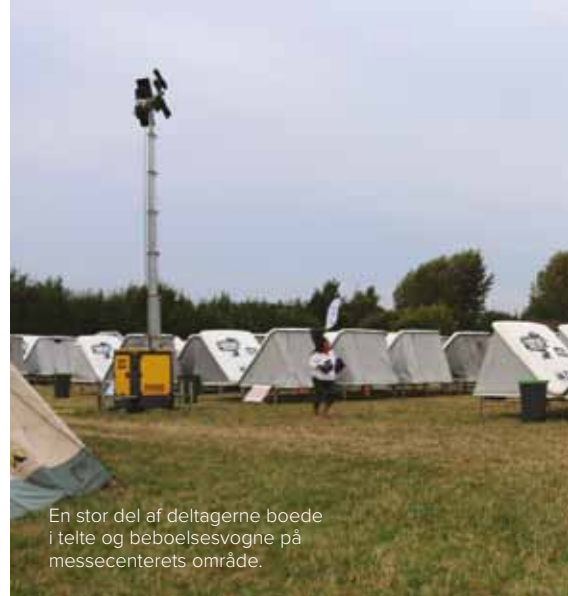
En stor del af deltagerne boede i telte og beboelsesvogne på messecenterets område.