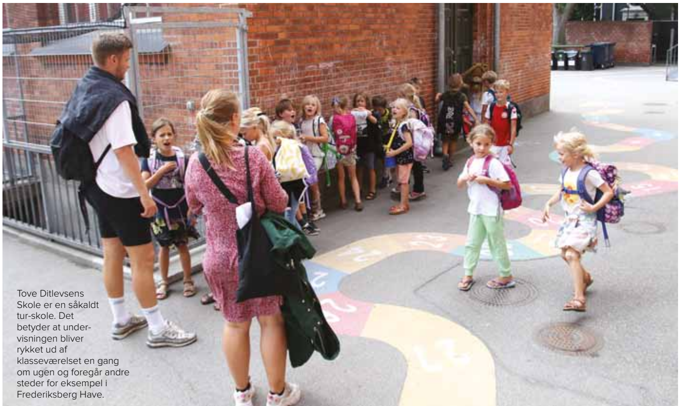
Tove Ditlevsens Skole er en såkaldt tur-skole. Det betyder at undervisningen bliver rykket ud af klasseværelset en gang om ugen og foregår andre steder for eksempel i Frederiksberg Have.