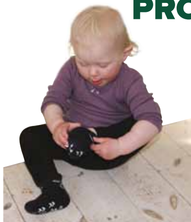
Børn, der ikke har fået udviklet deres finmotorik, kan få problemer med selv at tage tøj af og på, og de kan være udfordrede af opgaver, hvor man skal bruge begge hænder samtidig.

Børn , der ikke har fået udviklet deres finmotorik, kan have problemer med: